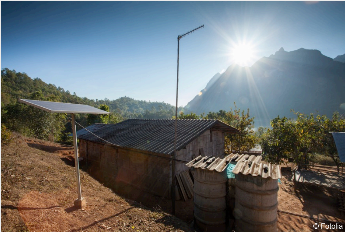
Panneaux solaires, zone rurale PED