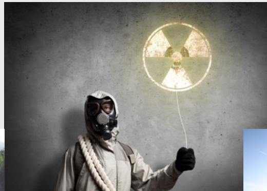
Dégâts après l'ouragan Katrina