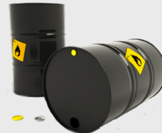
Barils de pétrole