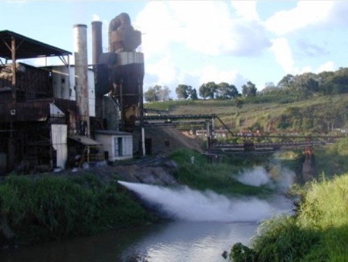
Usine au Brésil