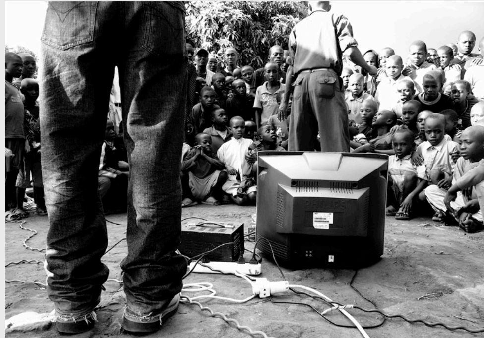
Enfants regardant la TV à Rubona, Rwanda