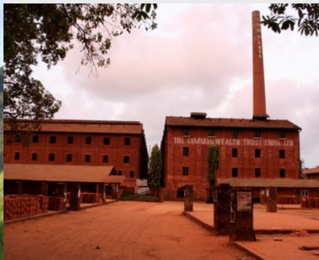
Fabrique de tuiles, Inde