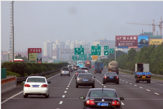
Jo. Sau, Hangzhou-Shangai . CC BY