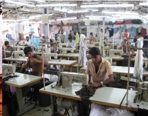
Usine textile, Inde