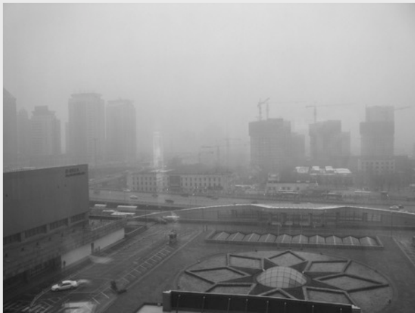
Kevin Dooley, Beijing Smog . CC BY