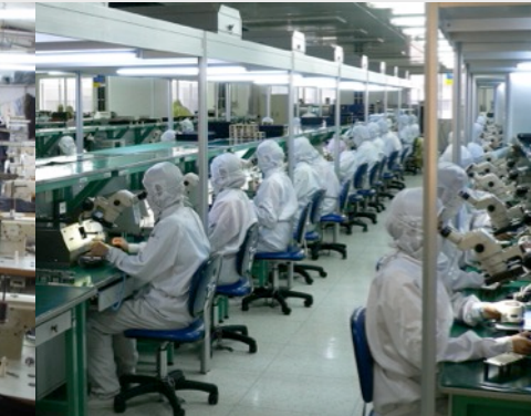
Fibre optique, Chine