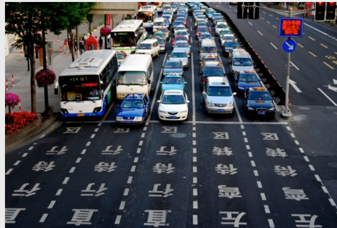
Carlos 2G2, Starting Block