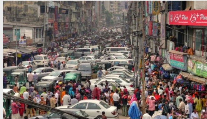
Worl Class Traffic Jam