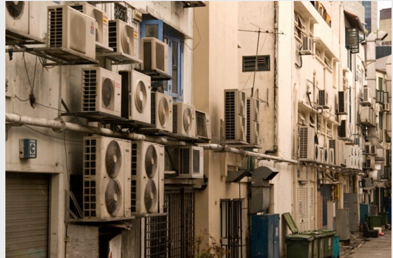
Draculina_ak, Air conditioning paradise . CC BY NC ND.