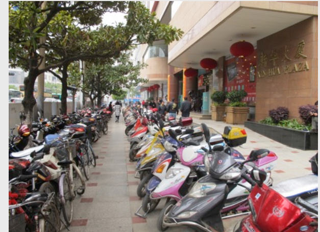
Itdp, Motorbyke and bicycle parking . CC BY