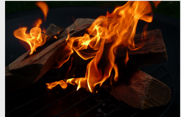
Lauren, Day 052 : jersey fire spit, CC BY NC