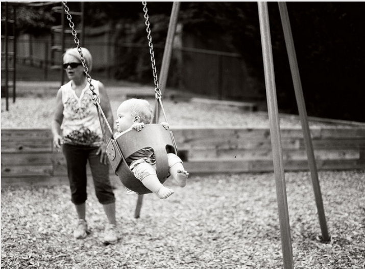
Tzdpde5, Swing baby , CC BY NC SA